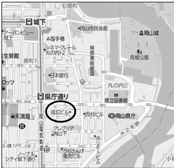
住所：岡山市北区内山下 1-3-19 建築会館（成広ビル）

一般社団法人岡山県建築士会 〒700-0824 岡山市北区内山下 1-3-19 建築会館 4 階 電話：086-223-6671 F A X：086-221-2185 一般社団法人岡山県建築士事務所協会 〒700-0824 岡山市北区内山下 1-3-19 建築会館 3 階 電話：086-231-3479 F A X：086-231-4575 ※建築会館（成広ビル）には専用駐車場がございません。近隣のパーキングをご利用ください。