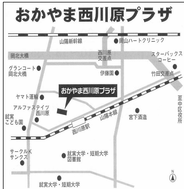
住所：岡山市中区西川原 2 5 5