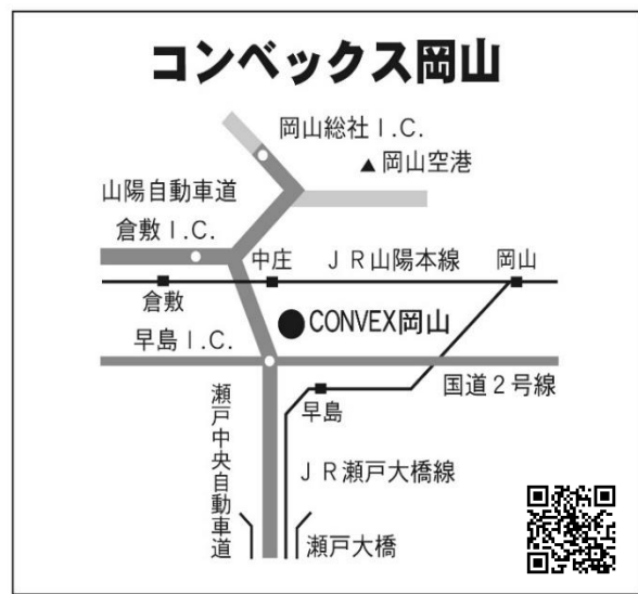
岡山市北区大内田 675