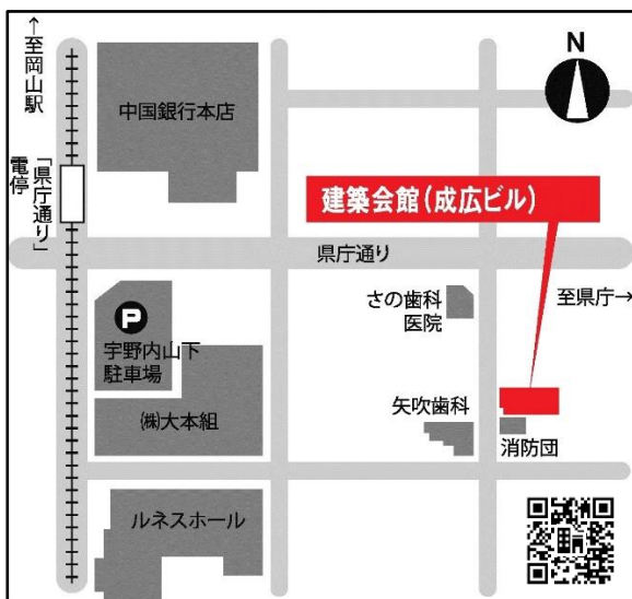
岡山市北区内山下 1-3-19 建築会館 3F